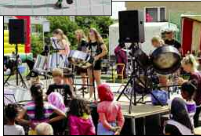
Klub Bøndergårdsvej stod for det musikalske.