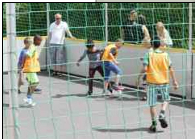
IF 92 Fodbold stod for Fair fodbolden.