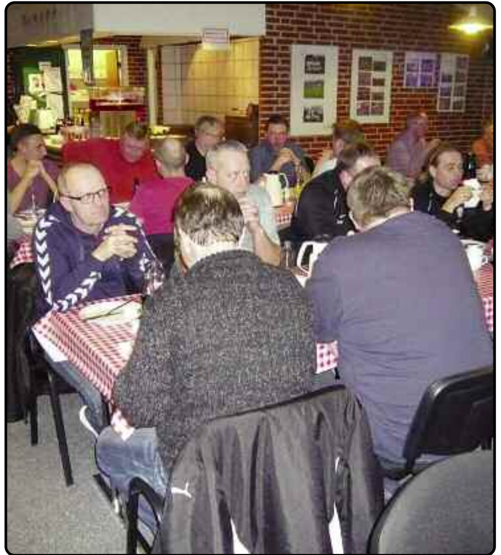
Generalforsamling i IF92 Fodbold

Resultatet må du selv smage dig frem til - men vi tror, at du er enig med os.