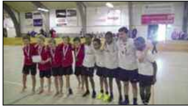
IF92 – Fodbold - Indefodbold