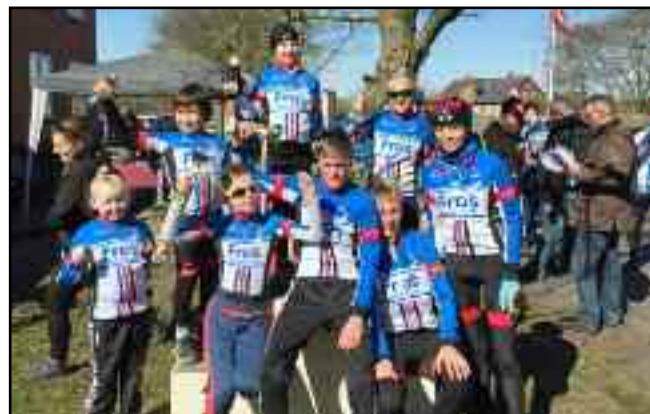
Nogle af børne/ungdomsrytterne efter indledningsløbet i Vester Nebel i april 2015.

Læs mere på klubbens hjemmeside www.esbjerg-cr.dk