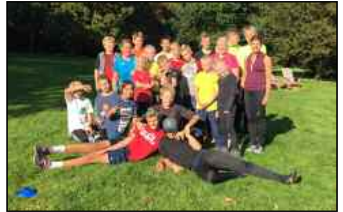
Gruppebillede fra crossfit i Vognsbølparken.

Unge med træningserfaring i alderen 15-16 år træner udendørs to gange om ugen tirsdag og torsdag fra 17:10-19. Mødested Strandbygade 78. Om lørdagen fra 10-12 tilbydes der i vintersæsonen MTB