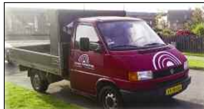
Den “nye” VW klar til nye opgaver.

Ring for gratis og uforpligtende tilbud ☎ 40 54 19 73