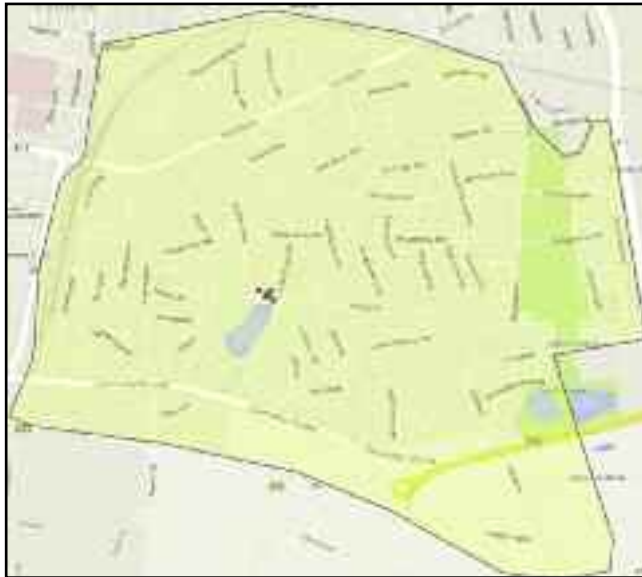
Grundtvigs sogn / Østerbyen.