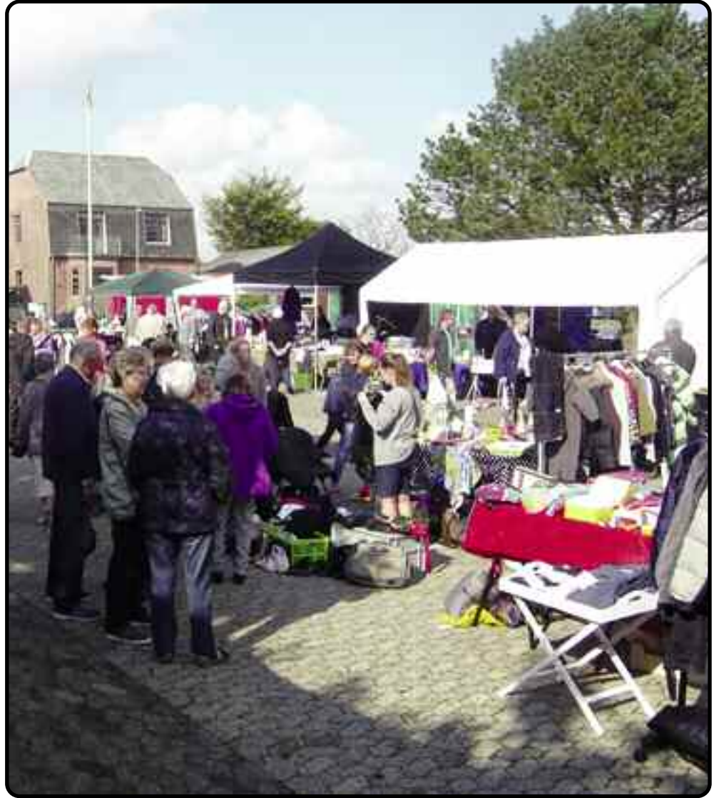
Den 3. årlige Jernedag på Jerne Torv

Resultatet må du selv smage dig frem til - men vi tror, at du er enig med os.